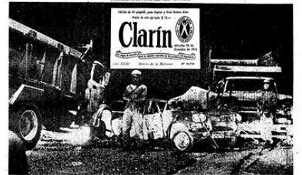
Los soldados del Ejército montan guardia junto a vehículos incendiados por los terroristas en Monte Canelo. Tras el ataque, los sobrevivientes fueron rápidamente repatriados.

que hoy más de 50 guerrilleros murieron. Los restos de seguridad fueron llevados y la familia de este soldado condecorado la repatriación de los sobrevivientes.