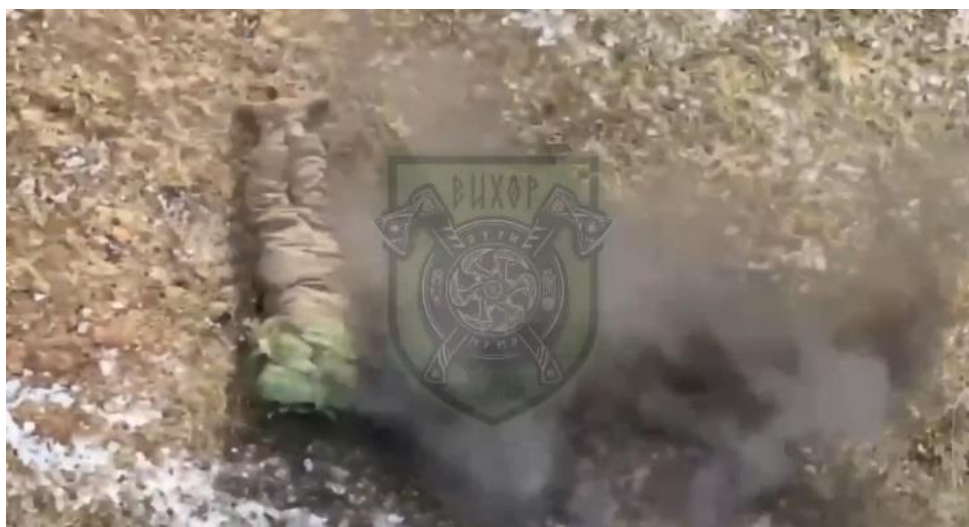
La muerte llega desde el cielo y se muestra por las redes

Lo expresado en el párrafo anterior describe buena parte de lo que a diario observamos en esta nueva dimensión en la que se libran las guerras: Las redes sociales. Muchos de estos clips, armados con el ritmo de un videojuego, nos llegan diariamente por centenares a nuestros teléfonos.