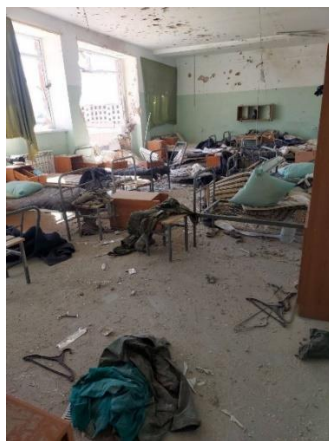
Imágenes de destrucción de hospitales y otros edificios civiles