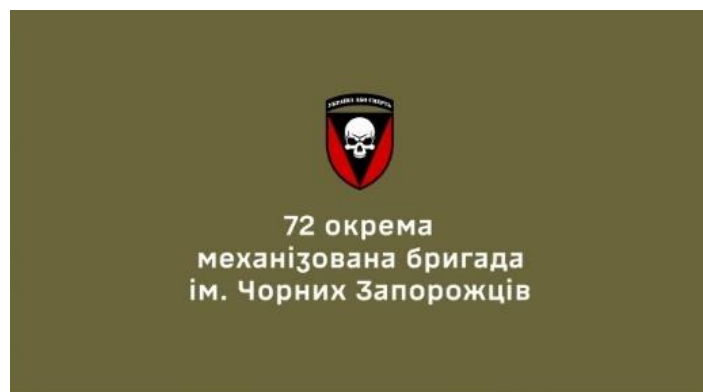
Logo de la 72da Brigada Mecanizada Independiente ucraniana en sus videos

En este punto es interesante destacar que, del lado ucraniano, ha sido posible ver que la ejecución de las acciones psicológicas se ha descentralizado a nivel brigadas. Es posible ver, entonces, que muchos clips tienen incluso los logos de las brigadas que los produjeron, como se puede ver en la imagen más abajo, de la 72da Brigada Mecanizada Independiente.