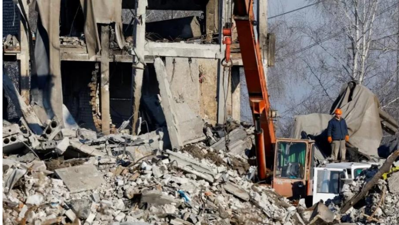
Lugar de concentración de tropas rusas en Makiivka, alcanzado por misiles HIMARS