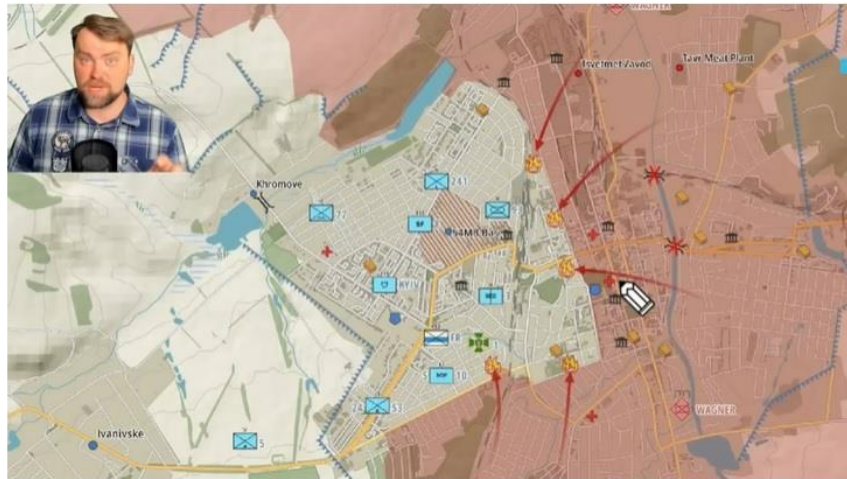
Update from Ukraine | How Will Ukraine Attack on the South? | Bakhmut situation is critical