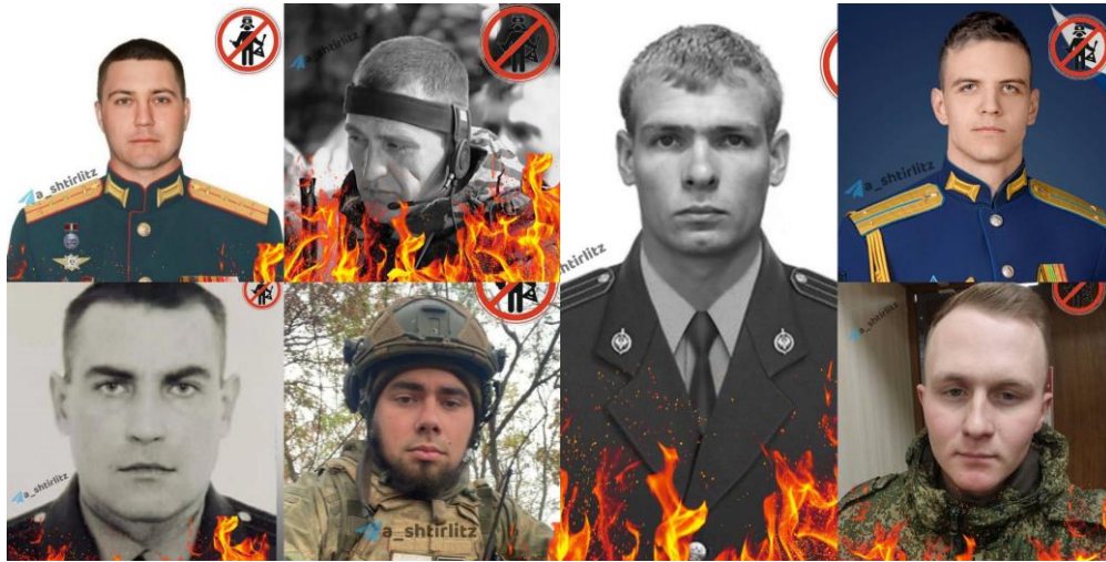
Oficiales rusos muertos en combate – fotografías publicadas en sitios ucranianos